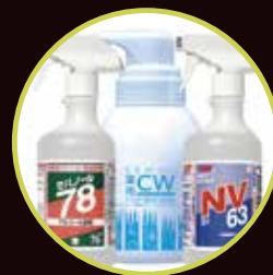
厨房の衛生的で清潔な環境作りを お手伝いするセーハージャパンコーナー