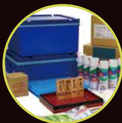
炊飯から製造・販売までの必需品 スズモ資材コーナー