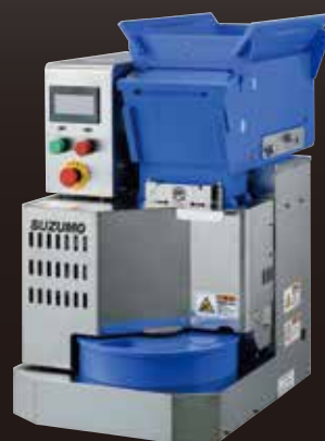
汎用おむすび成形機 MOS-FMC