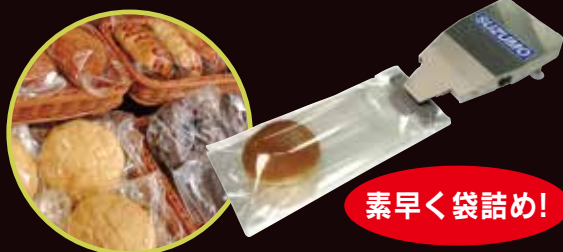
ペーカリー袋開口機・ペーカリー袋 &パン袋詰め実演コーナー