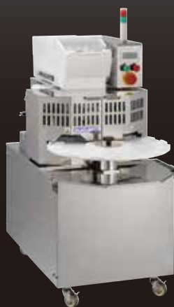
いなり寿司ロボット FIS-SND