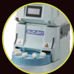
寿司ロボット・海苔巻きロボット他、 店舗用ロボット勢揃い