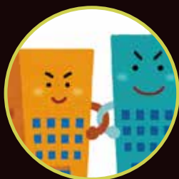
食材・資材・容器等 企業多数出展