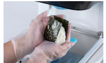
⑧おむすびの出来上がり