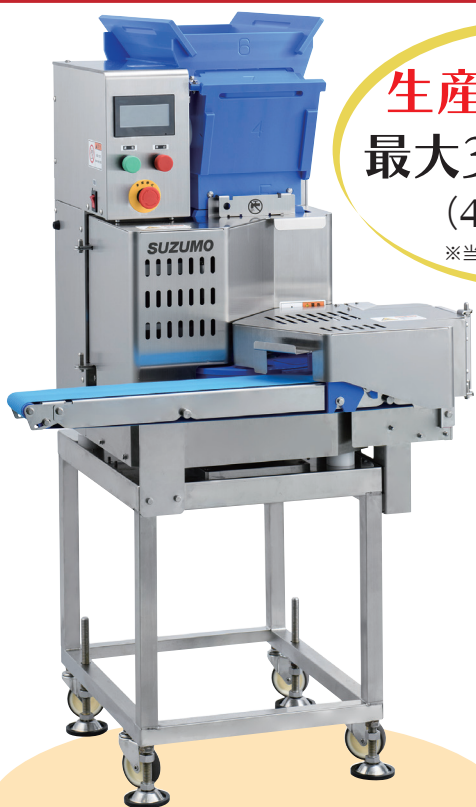
移載装置付排出コンベアおよび キャスター台装着仕様 (各オプション)

真空冷却飯 (油入:20~25℃) ・ ホット飯 (赤飯・おこわ等) に対応可能